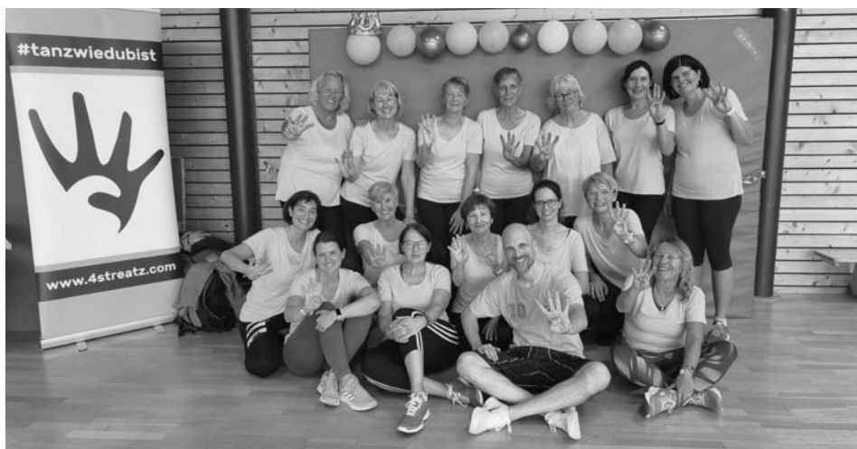
Alle freuen sich schon auf die nächste Party in 2026.