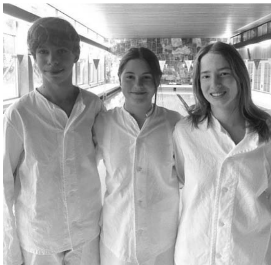
Kompakt-Lehrgang beim DLRG Sindelfingen

haben das Rettungsschwimmerabzeichen in Silber erworben.