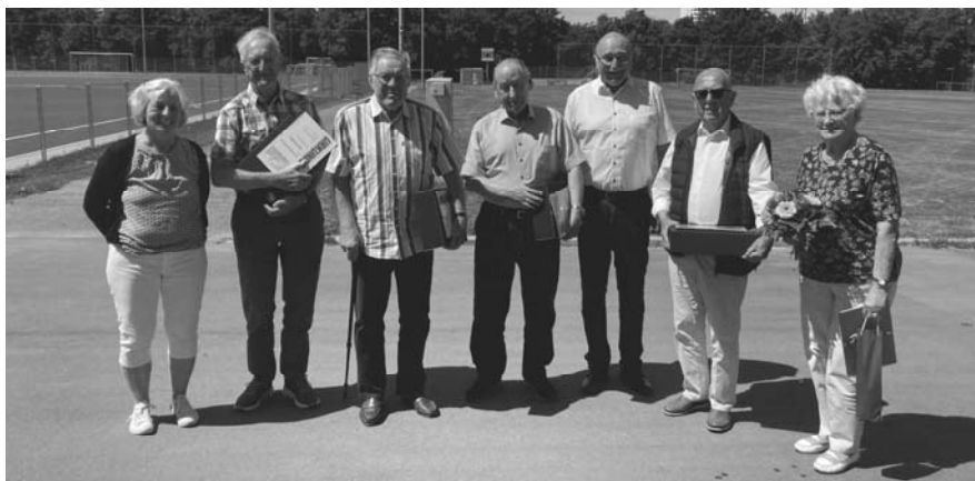
70 Jahre Mitgliedschaft