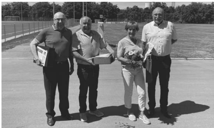
60 Jahre Mitgliedschaft – Ernennung zum Ehrenmitglied