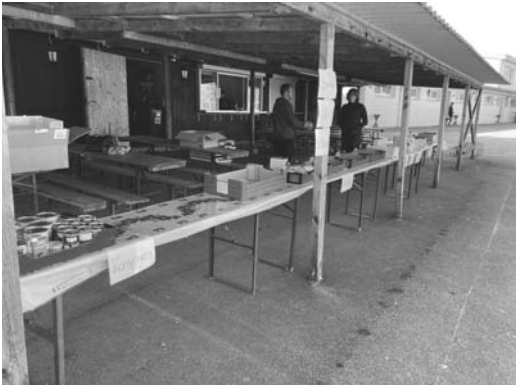
Kurz vor 10.00 Uhr - noch leer