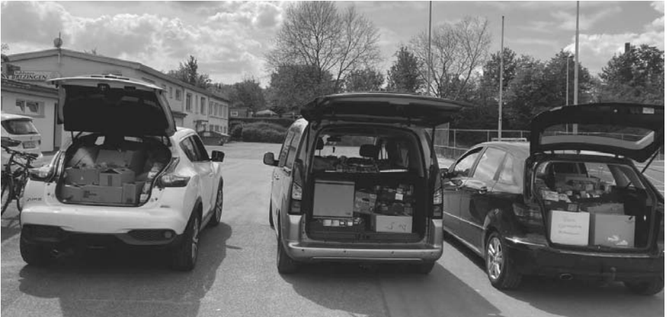
Drei komplett beladene Fahrzeuge voller Spenden