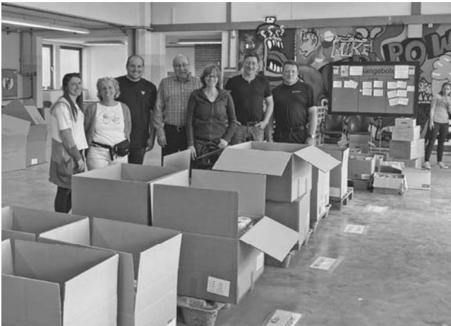
Alte Paketpost – Sammelstelle „3 Musketiere e.V.“

Beitragseinzug 2022 per SEPA-Lastschriftmandat - Vorabankündigung Abbuchungen werden jeweils zum 27. Februar, sowie für Neumitglieder am 01. Juli, bzw. am 01. November vorgenommen.