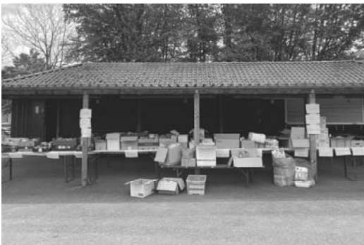
Um 14.00 Uhr – alles gefüllt mit reichlichen Spenden

Der lang anhaltende Krieg in der Ukraine beschäftigt auch den TSV Betzingen. Nachdem die ersten Jugendlichen aus der Ukraine in unserem Verein trainieren, hat es uns veranlasst, eine Spenden- und Sammelaktion durchzuführen. Es ist uns eine Herzensangelegenheit, die in Not geratenen Menschen in der Ukraine zu unterstützen.