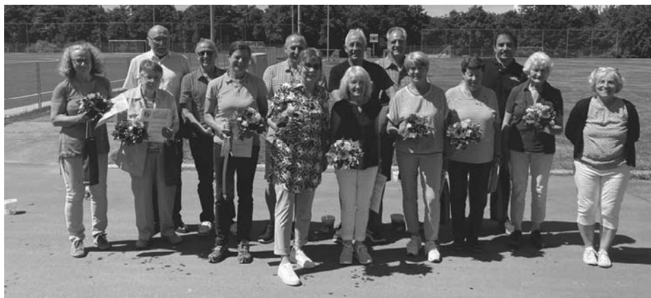
50 Jahre Mitgliedschaft – goldene Ehrennadel