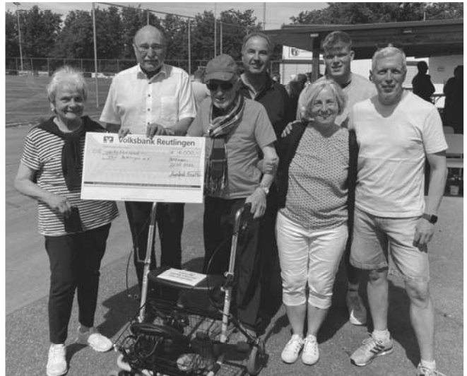
Ein großzügiger Scheck – vielen Dank! Der Jubilar umrahmt von Familie, Vorstand und Jugendleiter Fußball