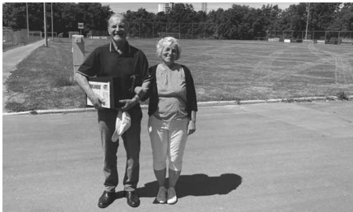
65 Jahre Mitgliedschaft