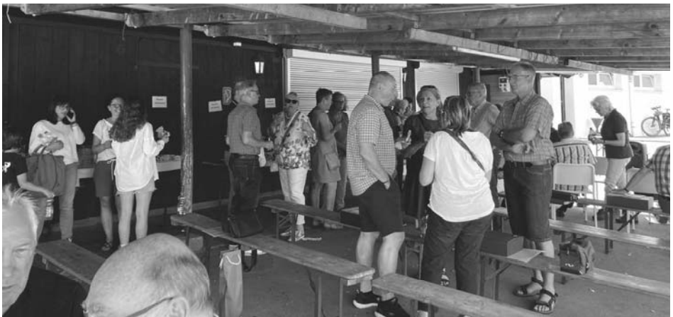
Plauschereien in gemütlicher Runde