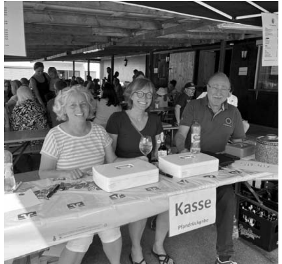
Gut gelauntes Kassenteam