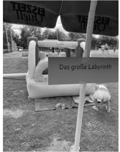
Das große Labyrinth