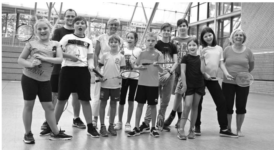
Glückliche Kinder – glückliche Trainer