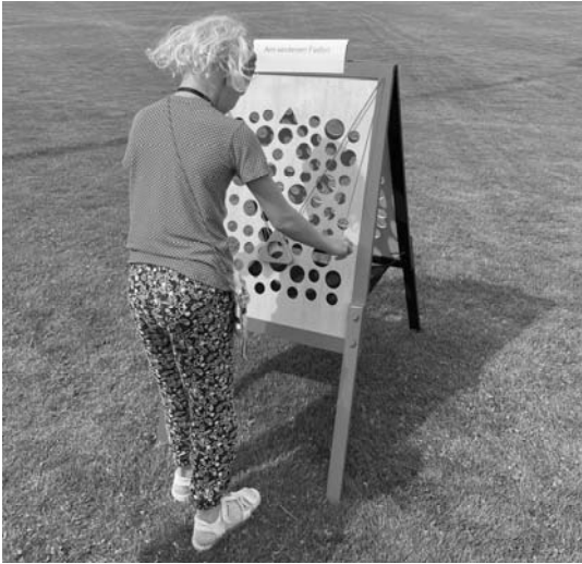
Am seidenen Faden