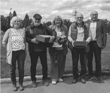
60 Jahre Mitglied mit Verleihung Ehrenmitgliedschaft