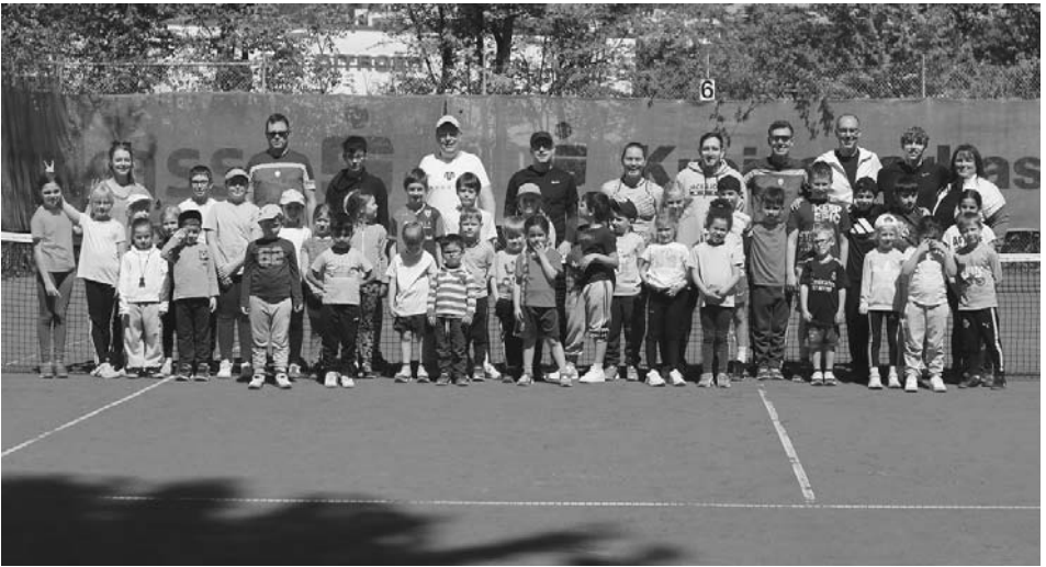
Kinder und Tennisbetreuer feierten ihren gemeinsamen Start in die Freiplatzsaison.

Was für ein herausragender und erfolgreicher Start in die Sommersaison!