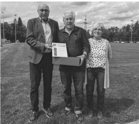
70 Jahre Mitgliedschaft