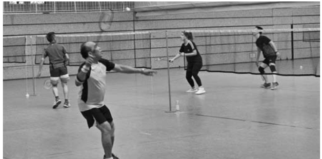
Spiel, Satz und Sieg?