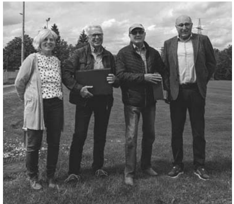
65 Jahre Mitgliedschaft