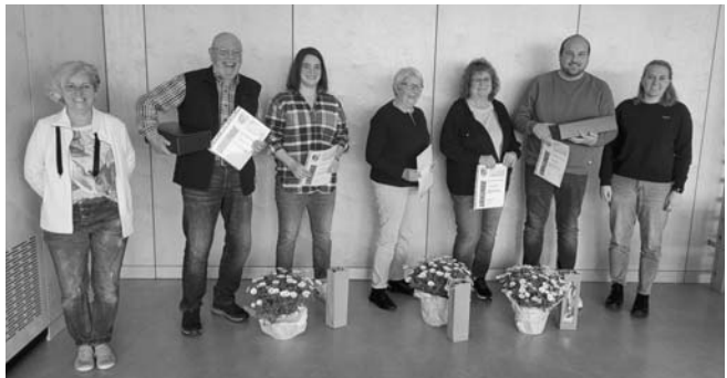
25 Jahre Mitgliedschaft