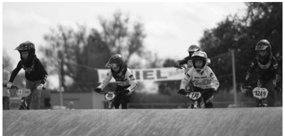
Boys 9-10 Beckert-Ledusic

Bäuchle erreichte gleich im ersten Vorlauf einen starken zweiten Platz im Fotofinish. Mit den weiteren Plätzen 6 und 5 reichte es sicher zum Halbfinale. Dieses beendet er auf dem 5. Platz. Im B-Finale zeigte er nochmal was in ihm steckt und erkämpfte sich einen guten 4. Platz. Linus Kreiss zeigte seine starke Form in Ingersheim und fuhr in seinen drei Vorläufen respektable Plätze (3/1/3) ein. Mit einem sehr guten 2. Platz im Halbfinale zog er ins Finale ein und beendete dies knapp hinter dem doch sehr ersehnten Podestplatz auf dem 4. Rang.