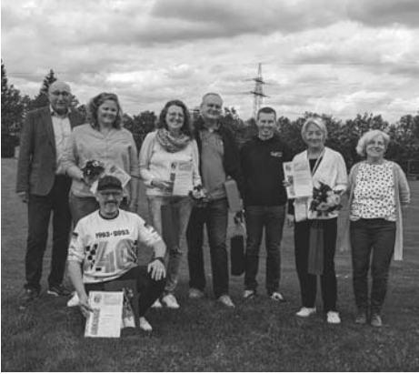
Ehrenamt silber, gold und 30 Jahre