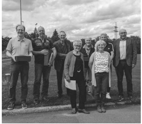
50 Jahre Mitgliedschaft