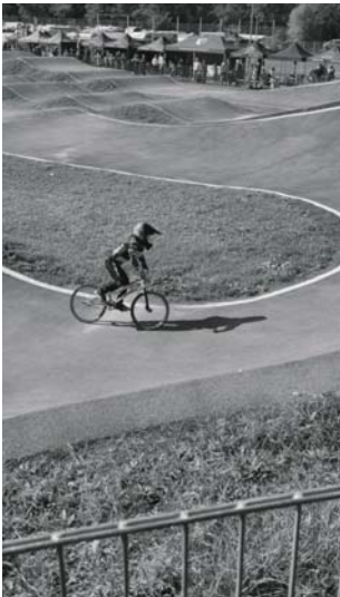
Elly Rauch girls 9-10

In der Klasse Girls 9/10 startete Elly Rauch, konnte sie sich noch am ersten Tag gegen ihre groß gewachsene Konkurrentin durch super Starts durchsetzen, gelang ihr das am zweiten Tag leider