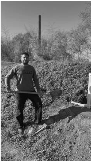
Joerg Schneider Fundamentbau